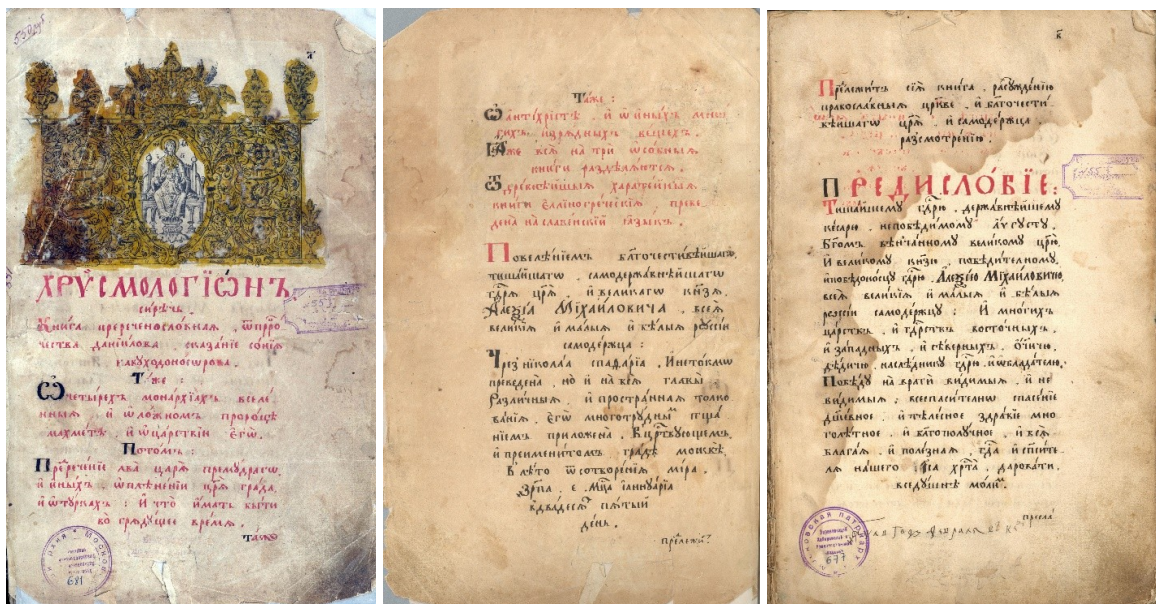
Рис. 2. Рукопись – находка московских археографов 1958 г. Николай Спафарий. Хрисмологион, рукопись 1700–1701 г.

Место хранения: Научная библиотека Хабаровской духовной семинарии, инв. вр. хр. № 44.