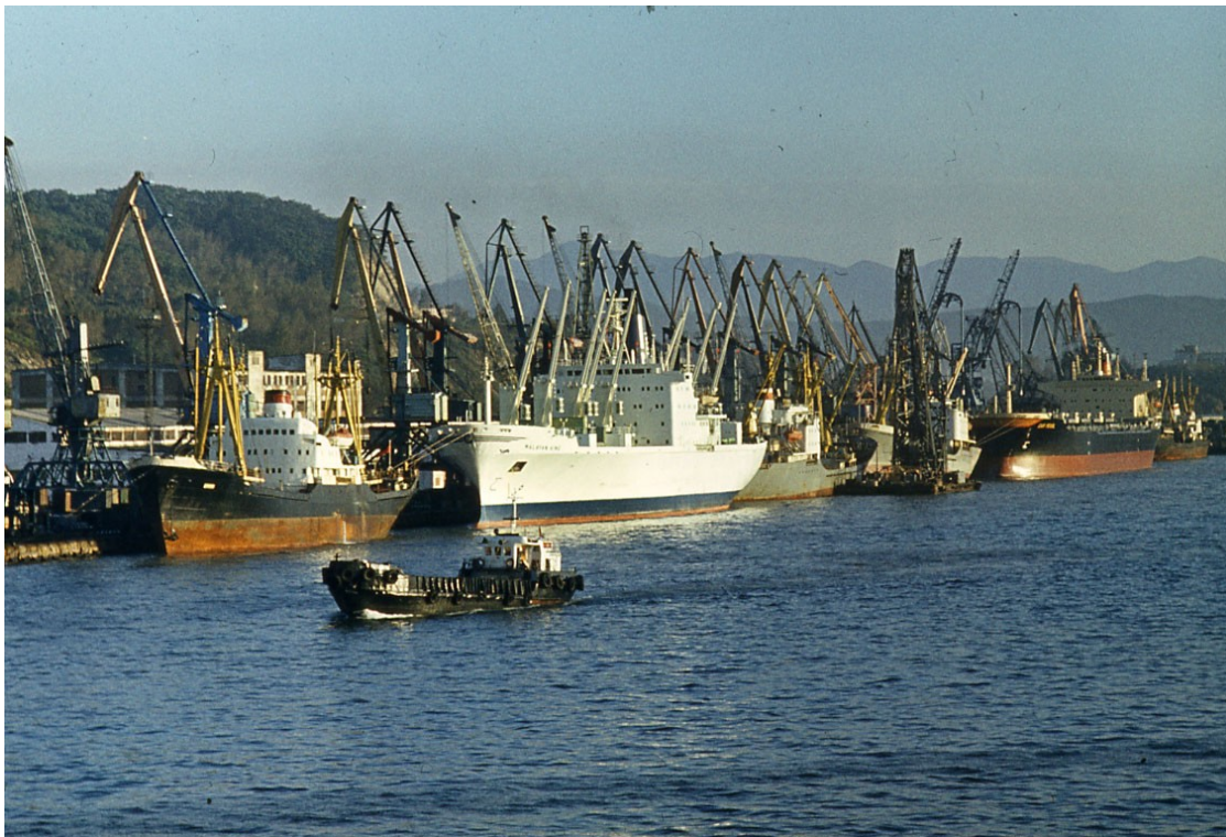
Рис. 1. Владивосток – портовый город, фото 1983 г.