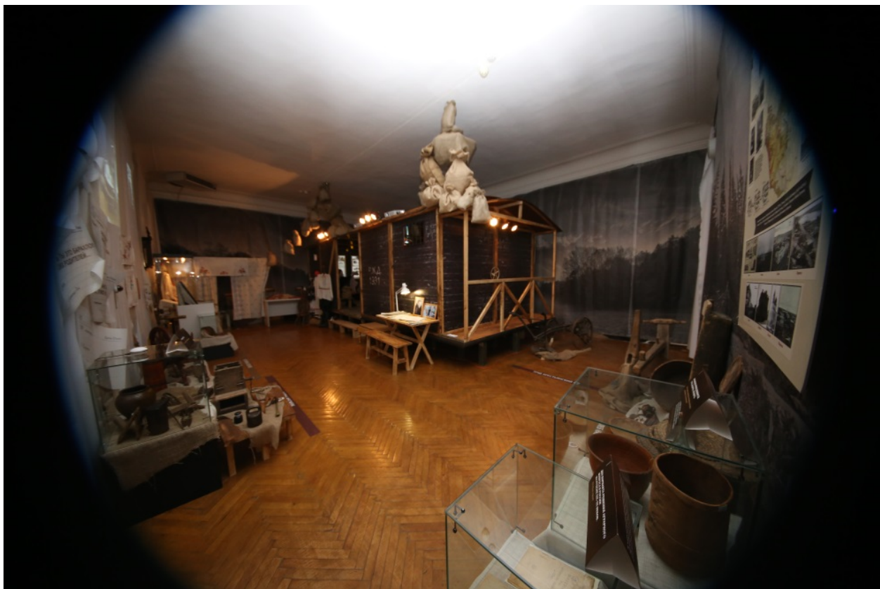
Общий вид выставки «Сибиряки вольные и невольные». Фотография Черновой Т.И. 2014 г.

информация о причинах, ходе переселения и адаптации переселенцев на местах, их правовом статусе и поддержке, оказываемой им со стороны государства, а также результатах для региона и страны двух главных потоков крестьянской миграции: добровольной (1906–1914) и принудительной (1930–1937).