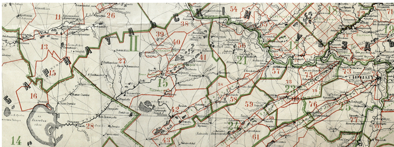
Фрагмент карты Алтайского округа с частью территории Барнаульского уезда в районе Барнаульского, Касмалинского и Кулундинского боров. 1911 г. Зелеными границами и цифрами отмечены лесничества Алтайского округа. Красными линиями обозначены границы лесных дач.

тельного согласования передаваемых участков 14 . Защита хозяйственных интересов округа при образовании участков возлагалась на командируемых для этой цели представителей округа – лесничих. В апреле 1911 г. для них была издана инструкция, перечислявшая категории земель, не подлежащие передаче в колонизационный фонд. Результатом всех мер, принятых в 1910–1911 гг., стало резкое снижение передачи кабинетских земель округа переселенческому управлению (в 1911 г. этот показатель сократился на 72 % по сравнению с 1909–1910 гг.) 15 .