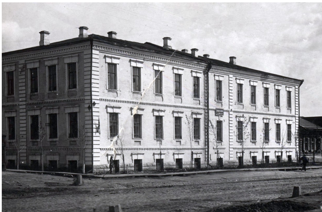
Здание бывшей тюрьмы на улице Мичурина (Александровской). Фотограф И.С. Моторин, 1934 г. Из фондов Новосибирского государственного краеведческого музея. ОФ-10689

еще в 1904 г. получил бесплатно довольно приличный выгон, но землю тюремному ведомству предоставлять не спешили, ссылаясь на то, что «земли нет» 44 .