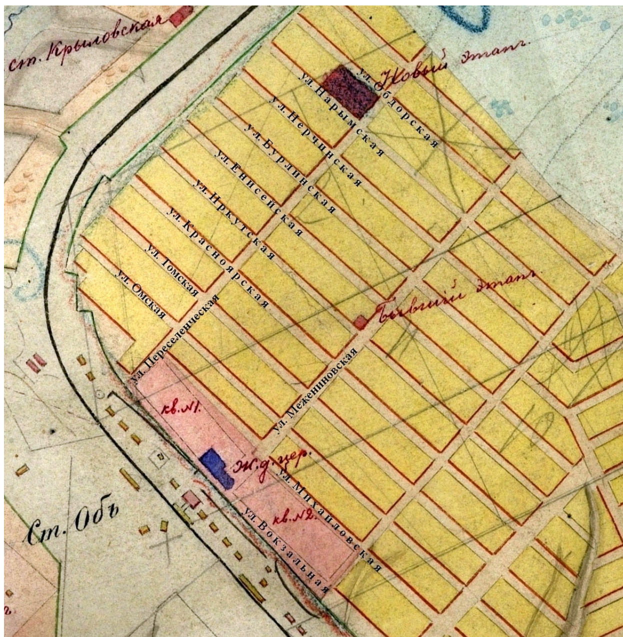
Схема расположения этапа на плане усадеб поселка Новониколаевского и прилегающих к нему земель. 1901 г.

ченных по сравнению с Каинском и, тем более, с Кольванью. В 1899 г. томский губернатор предполагал начать строительство этапа на 40 человек на железнодорожной станции Каинск, была сделана смета и проект, однако осенью следующего года в Главном тюремном управлении вместо Каинска решили построить этап на станции Обь, притом увеличив размер этапа до 150 заключенных. На территории Обского этапа кроме тюремного здания планировалось строительство казармы для конвойной команды на 75 человек и дом начальника. Решение тюремного ведомства было губернатором поддержано, и весной 1901 г. началось строительство этапа хозспособом. Смета на постройку составила 35 тыс. рублей – помещения были деревянными 48 . Возможно, этот факт не связан с открытием этапа в Новониколаевске, но в 1903 г. в Томске закрылась центральная пересыльная тюрьма, откуда на протяжении 30 лет отправлялись этапы в Восточную Сибирь и Нарымский край 49 .