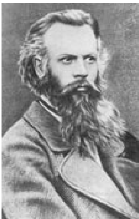
Николай Михайлович Ядринцев 70-е годы XIX века.