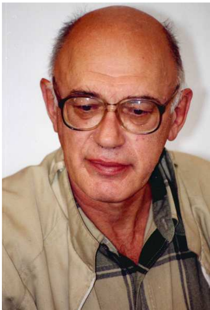
Дмитрий Яковлевич Резун

«Краткой энциклопедии по истории купечества и коммерции Сибири» 1 и последующего ее переиздания в виде «Энциклопедического словаря по истории купечества и коммерции Сибири» 2 . Д.Я. Резун – автор сотен публикаций, отражающих самые разные аспекты истории Сибири и России конца XVI – начала XX в.