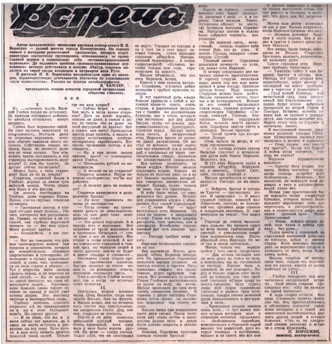
Рис. 1. Рассказ И.К. Борискина «Встреча» (Кузнецкий рабочий. 1966. 22 нояб.)

Довольно интересно с этнографической точки зрения и изучения так называемой «малой эсхатологии» изображено само действо, хотя и с долей критики 9 . При пробуждении «с того света», среди прочего, Иеремия говорит: «Два ангела Господня взяли мою душу до пояса из тела, и вознеслись мы до поклонения ко Господу. Близко Бога я, грешный, не мог лицезреть. Видел я только издали свет великий да слышал, как глас трубный глаголил: «Скоро гряди на землю грешную, буду судить люди моя судом праведным; уничтожу и развею прах нечестивых, предам геенне огненной души беззаконников и неверующих в меня... Проклинаю отныне именем моим всех... — тут монах окинул острым взглядом всех и злобным шепотом продолжал, — безбожников, партийцев, комсомольцев и страшной карой накажу тех родителей, дети которых пионеры и октябреньки, накажу и их самих, ибо все они живут в разврате и беззаконии». У Василья пересохло в горле, на глазах выступили слезы. Он так рвался в пионеры, а выходит, что даже сам Бог запрещает. Монах еще долго возвещал об аде и рае...». Его видения прерываются вестью о том, что вернулся с фронта без руки муж одной из слушательниц. В третьей части рассказа Борискина его герой-лектор заключает: