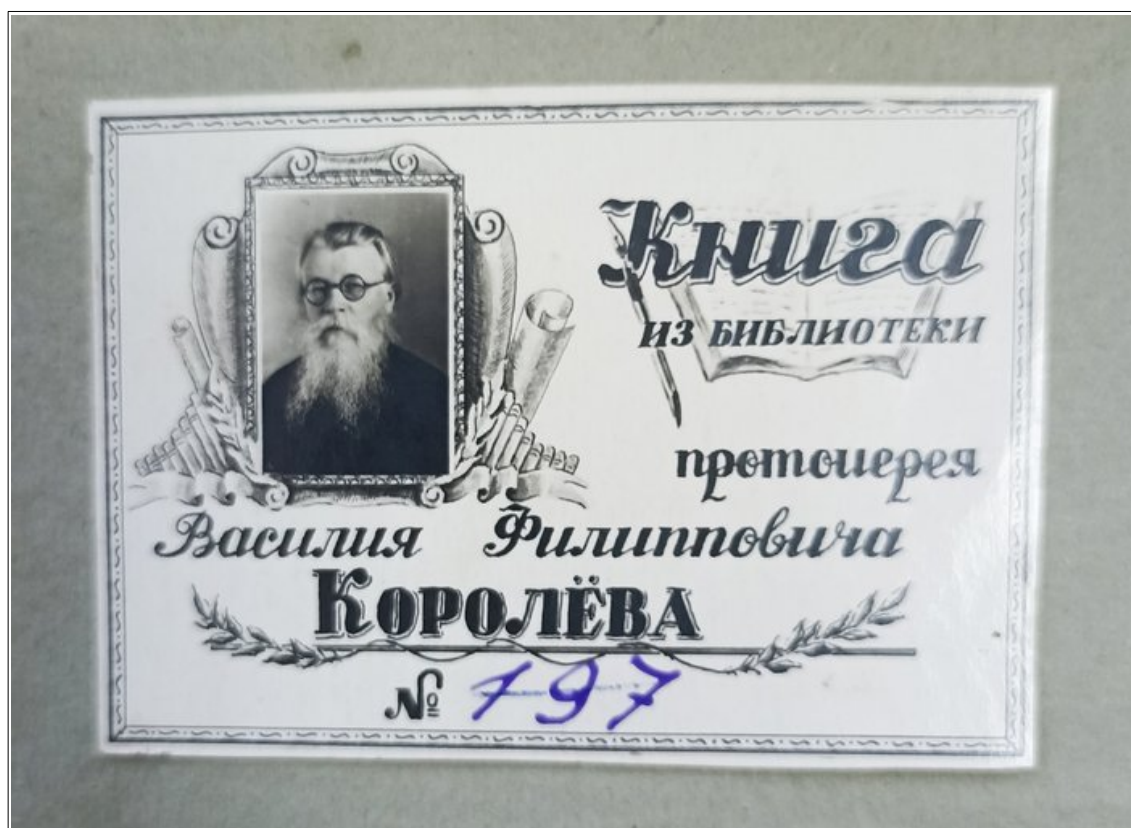
Рис. 2. Эслибрис прот. В.Ф. Королева в конвюлите из семи старообрядческих сочинений, изданных в к. XIX – нач. XX в. (библиотека Кузбасской православной духовной семинарии)

Большой интерес представляет конвюлот из нескольких изданий, ранее принадлежавший библиотеке протоиерея Василия Филипповича Королева. В.Ф. Королев – настоятель московского Покровского кафедрального собора на Рогожском кладбище, обладал большой личной библиотекой и был попечителем библиотеки Покровского собора 18 (рис. 2).