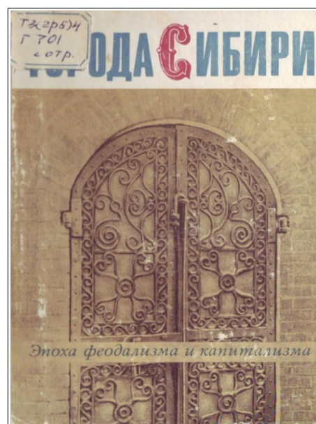
Рис. 3. Города Сибири эпоха феодализма и капитализма. Новосибирск, 1978