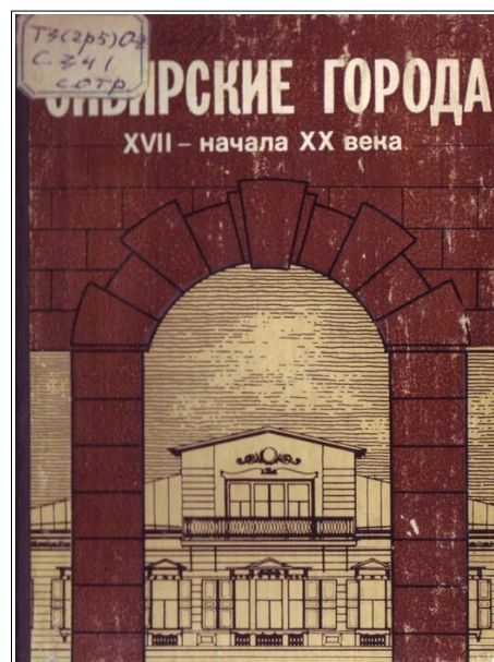
Рис. 4. Сибирские города XVII – начала XX века. Новосибирск, 1981