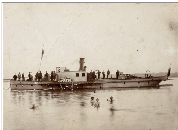
Рис. 1. Пароход «Новониколаевск». Фото начала XX в.