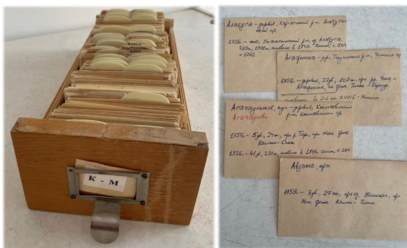
Рис. 2. Картотека населенных пунктов Новосибирской области

Картотека населенных пунктов Новосибирской области включает 974 карточки с информацией о старейших поселениях региона, основанных в XVIII – начале XX в.: их названия, месторасположение, даты упоминаний в источниках и литературе, число дворов и жителей в разные годы (рис. 2).