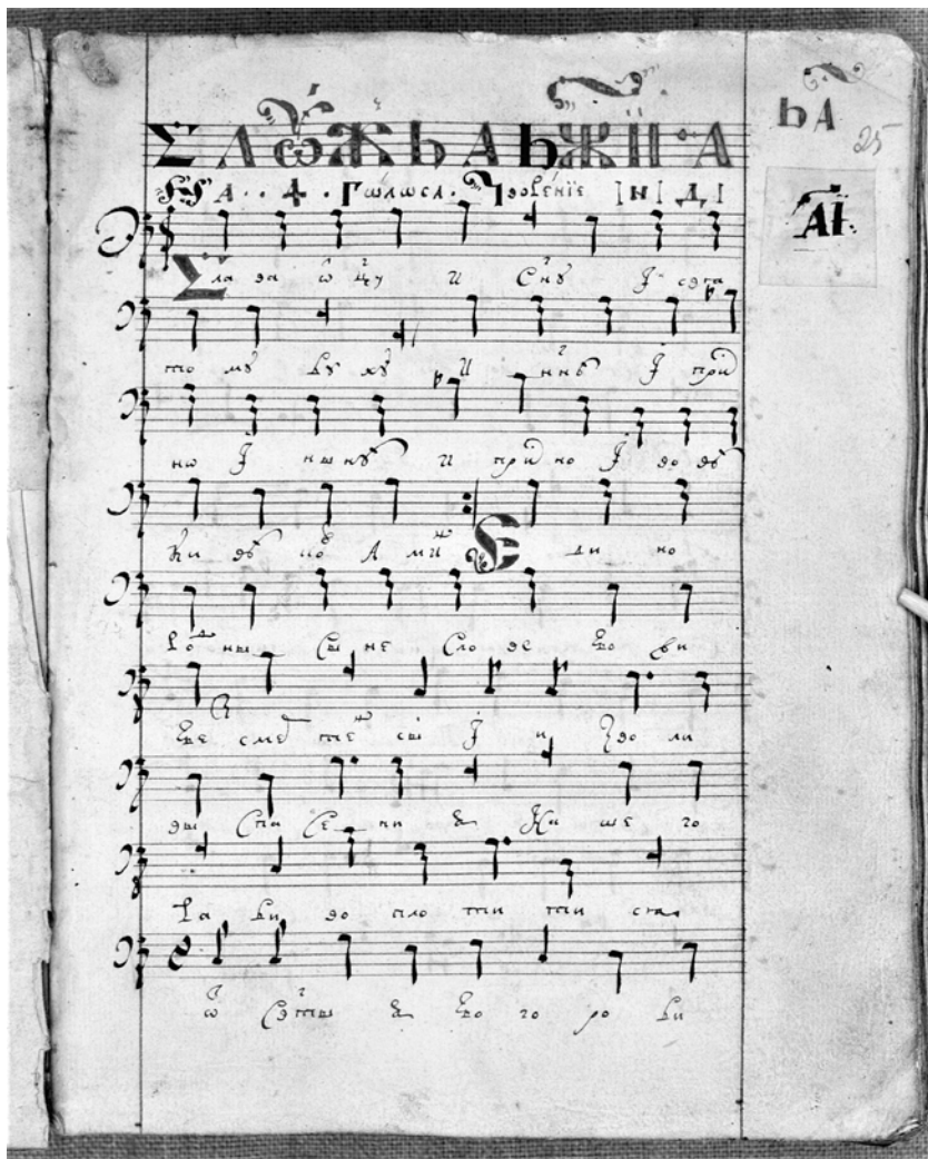
Тхм-503. Сборник партесных композиций (партия баса). Начало XVIII в. Л. 25

норечной редакции, но с дореформенной лексикой и грамматикой (Тхм-204, Тхм-449, Тхм-460, Тхм-626). Новоистинноречная дореформенная редакция также свойственна певческим книгам поповской традиции, представленной в собрании М. Н. Тихомирова всего двумя кодексами третьей четверти и последних десятилетий XVIII в. (Тхм-288 и Тхм-333 соответственно).