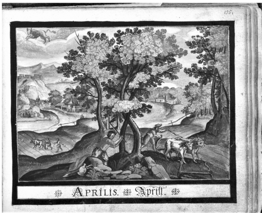
ГПНТБ СО РАН. Тихомировское собр. № 10-ин. XVII в. С. 155. Апрель (Телец астрологического календаря). Бумага, кисть, краски