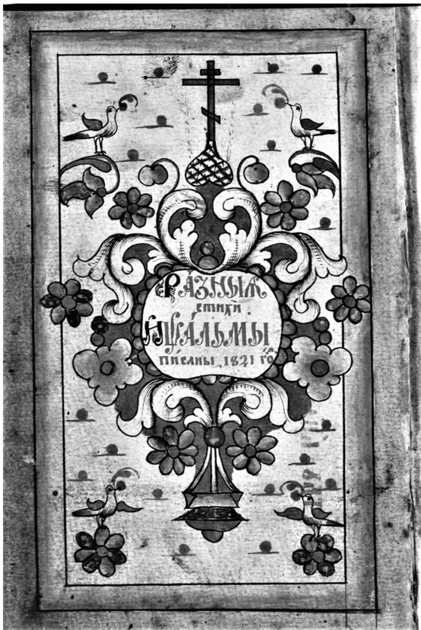
ГПНТБ СО РАН. Тихомировское собр. № 448. «Разныя стихи и паслымы». 1821 г. Л. 1 об.-2. Поморский стиль книжного оформления