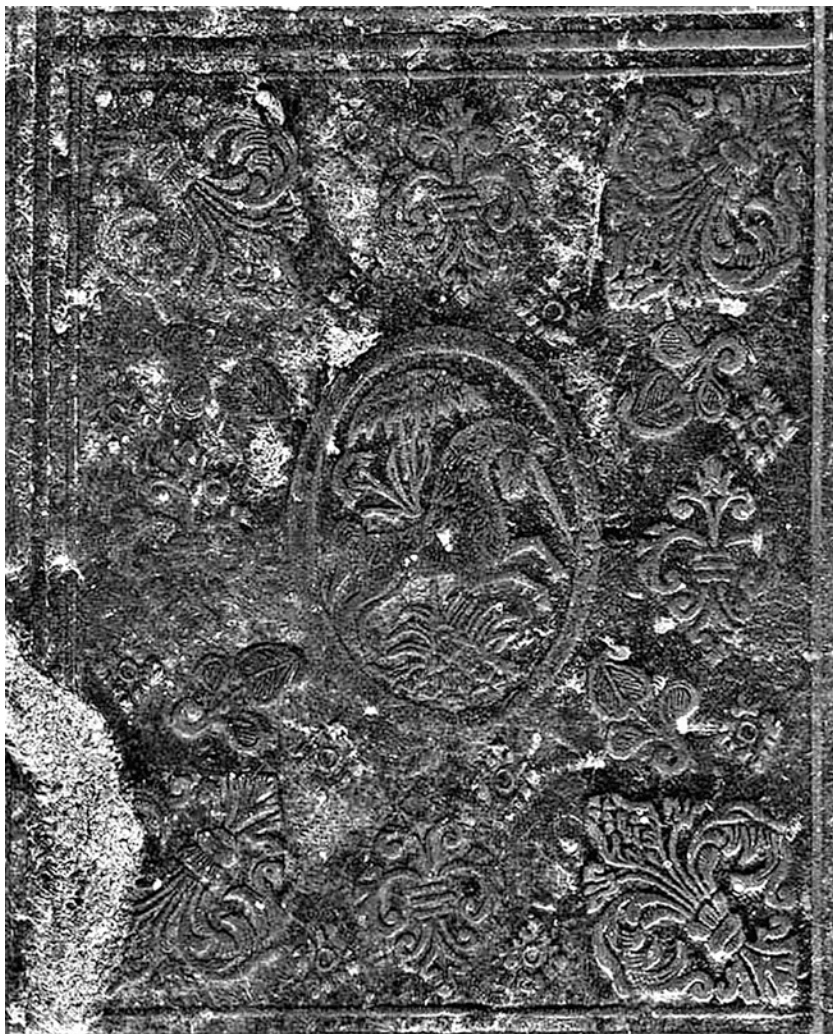
Тхм-99. Азбуковник. Первая треть XVII в. Фрагмент переплета — оттиск единорога в центре верхней крышки. XVIII в.