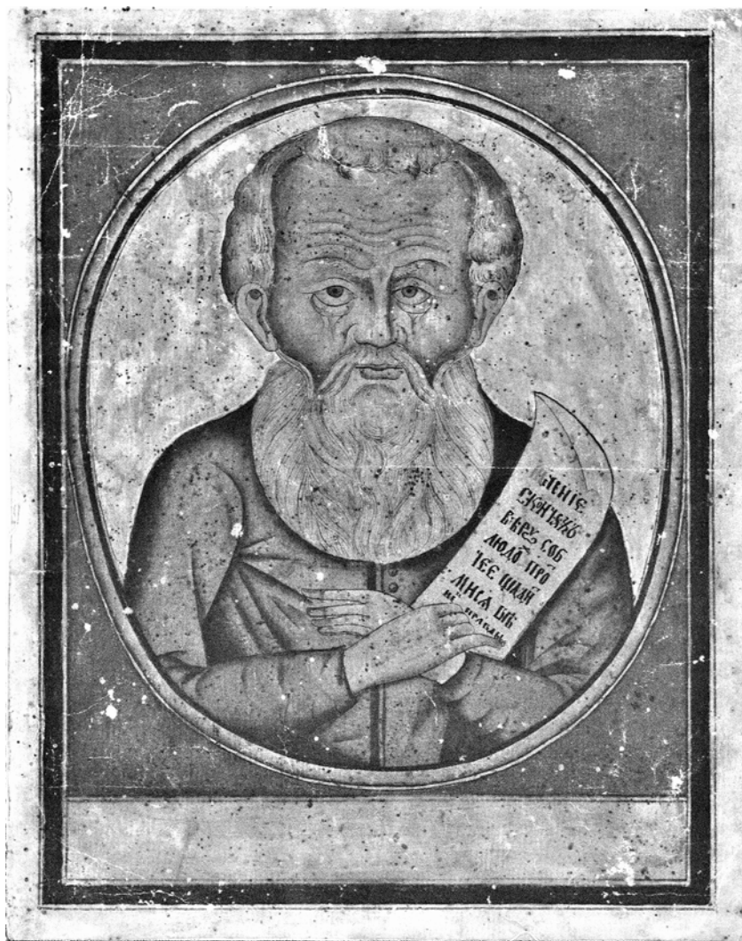
ГПНТБ СО РАН. Тихомировское собр. № 648. XIX в. «Мучение скончах, веру соблюдох. Протчее щадит ми ся венец правды». Портрет неизвестного наставника