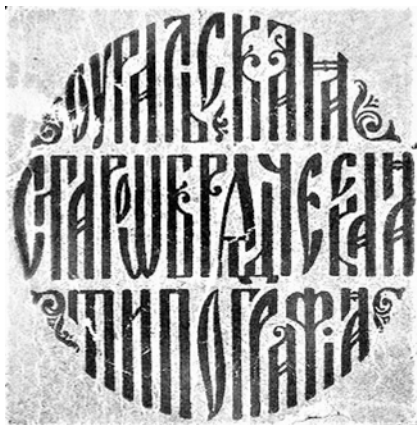
Логотип типографии А. В. Симакова

Документов, отражающих сам процесс создания типографии, не сохранилось, но поскольку официально заведение называлось «Старообрядческая