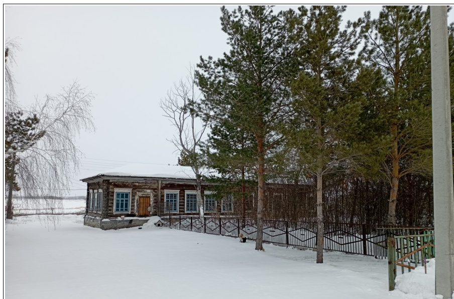
Рис. 1. Здание детского дома в пос. Суздалка Доволенского района Новосибирской области. Современное состояние

в отделе архива Администрации Доволенского района Новосибирской области отложено постановление исполнительного комитета Доволенского районного совета депутатов трудящихся и бюро РК ВКП(б) Новосибирской области от 15.06.1942 г. «О мерах по приему, расселению и трудоустройству эвакуированных из г. Ленинграда» 18 .