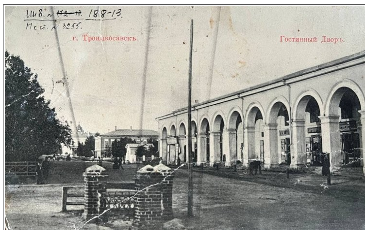
Рис. 3. Вид на Гостинный двор.