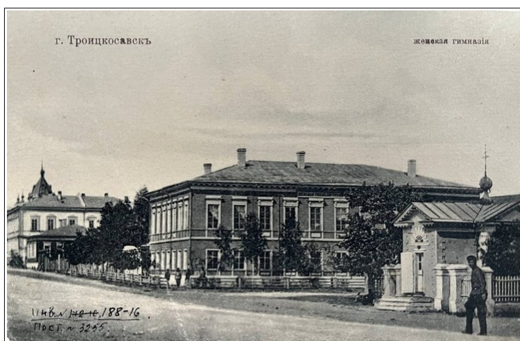
Рис. 2. Женская Троицкосавская гимназия.

В 1890 г. в бюджетах всех прогимназий области проценты с неприкосновенных капиталов составили 389 руб. 73 коп., а пожертвования попечителей и других лиц – 4 602 руб. 77 коп. Городские и уездные училища не имели целевых капиталов, дополнительные средства получали от пожертвований. В начальных училищах – 804 руб. 75 коп. и 5 883 руб. 43 коп. соответственно, т.е. 0,8 % от всех сумм 29 ,