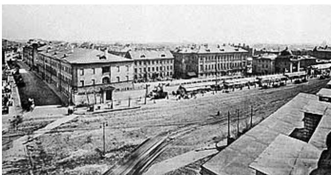
Рис. 3. Спасские казармы на Садовой-Спасской улице в Москве. Фото: П.П. Павлов, 1910-е гг.

Всю дорогу в вагоне-теплушке до Варшавы солдаты играли в «двадцать одно очко», «...издевались насколько хватало остроумия над российскими порядками и своим российским начальством за глупость и неповоротливое тугодумие, а главное – повальное казнокрадство, скарденность, что даже при посылке на фронт, на смерть не обеспечить этих солдат даже нормальным питанием, вынужденным на каждой станции “шкалить”» 11 .