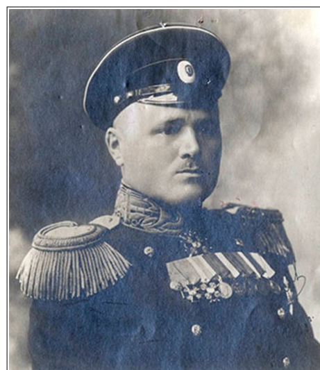
Рис. 2. Д.Ф. Котельников.

Фото из фондов Российского государственного музея Арктики и Антарктики, о/ф 13-8920/1