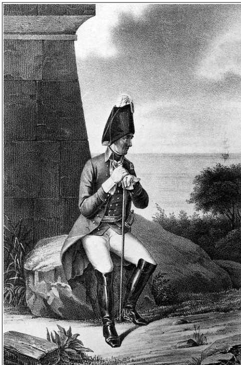
Рис. 2. Обер-офицер гарнизонного батальона русской армии второй половины XVIII в. Висковатов А.В. Историческое описание одежды и вооружения российских войск. Спб.: Тип. В. С. Балашова, 1900. Ч. 6. С. 125

пьянства отлучки и за оболгание, якобы его отпустил комендант, и за многие невоздержные пьянства» был признан негодным к дальнейшему повышению 12 , однако через полтора десятка лет, в 1784 г., мы обнаруживаем его с чином капитана в должности заседателя нижнего земского суда Кольванского уезда 13 .