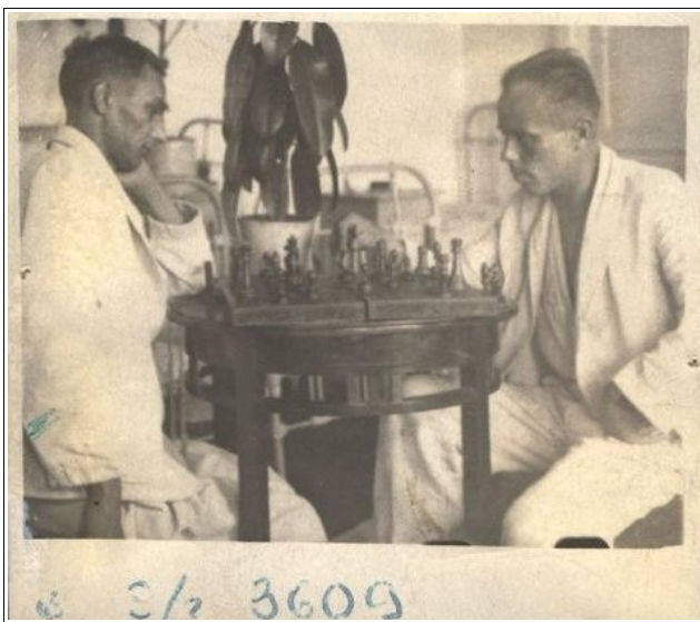
Рис. 1. Раненые эвакогоспиталя № 3609 (г. Новосибирск) за игрой в шахматы.

Активное участие в социальной адаптации раненых принимали представители шефских организаций, общественности, школьники и студенты. Например, активисты Красного Креста учащиеся школы № 10 г. Новосибирска ухаживали за слепыми