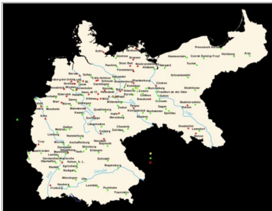
Рис. 4. Карта лагерей для военнопленных в Германии в годы Первой мировой войны

С этого момента, 17 часов 28 апреля 1915 года, началась моя новая фаза жизни – в немецком плену» 14 .