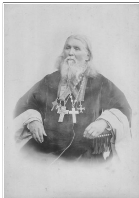
Рис. 4. Протоиерей Димитрий Иоаннович Евтихий. Енисейск, 1899.

В 1885 г. протоиерей Д. Евтихий на страницах семи номеров «Енисейских епархиальных ведомостей» опубликовал очерк об истории Иверского монастыря. В этом очерке, ссылаясь на некую летопись, т.е. повторяя высказывание архимандрита Афанасия, Д. Евти-