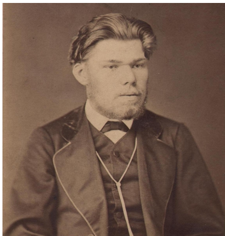
Рис. 8. Кытманов Александр Игнатьевич (1858–1910). Основатель Енисейского краеведческого музея.