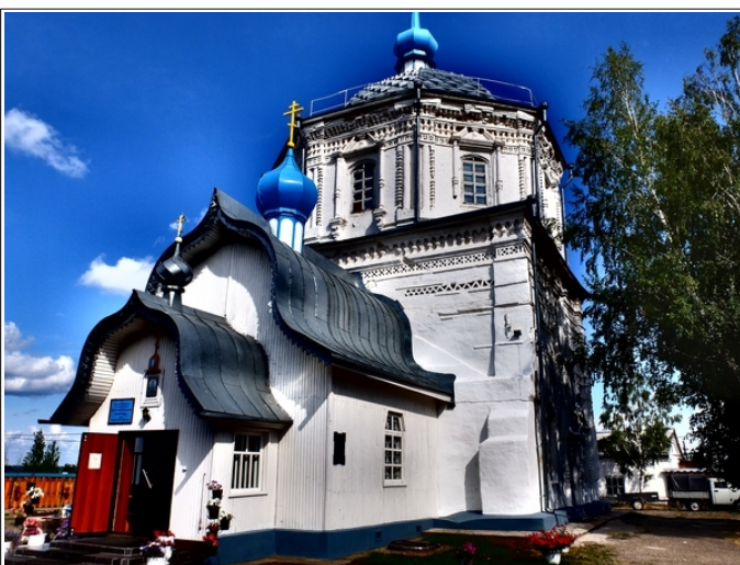
Рис. 2. Воскресенская церковь, переданная Иверскому монастырю. Фото автора, 2019 г.