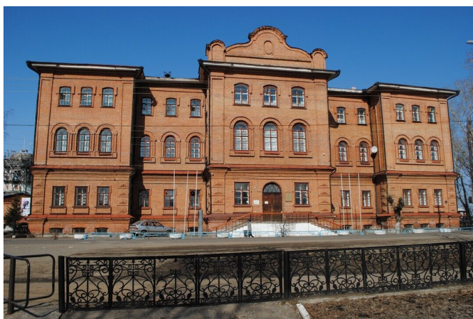
Рис. 6. Енисейская мужская прогимназия (в последующем – гимназия). В настоящее время – школа № 1.

и духовный лидеры города, были не просто хорошими знакомыми, но имели если не дружеские, то приятельские отношения. В этой ситуации, на наш взгляд, А.И. Кытманов (рис. 8) из уважения к заслуженному деятелю города и к своему отцу просто не мог не включить в свою «Краткую летопись Енисейска» изложенную в брошюре протоиерея Д. Евтихийева информацию об основании в Енисейске женского монастыря в 1623 г. А.И. Кытманов,