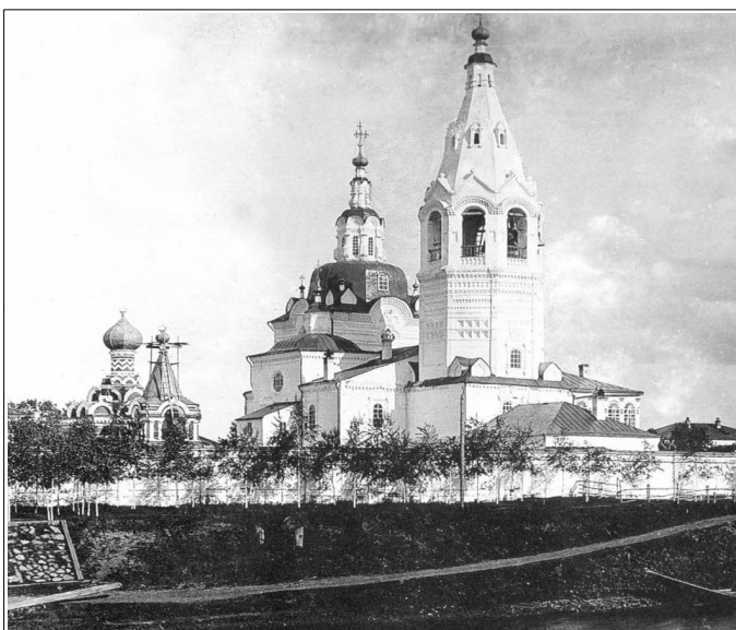
Рис. 1. Енисейский Иверский (Христорождественский) девичий монастырь. Фото конца XIX в.