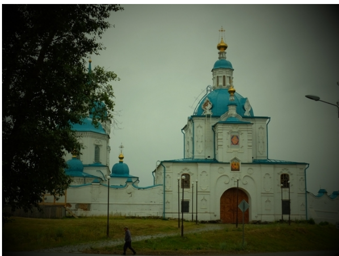
Рис. 3. Енисейский Спасский мужской монастырь. 2019 г.

При этом известно, что в начале 1650-х гг. енисейский воевода А. Пашков отводил для Рождественского монастыря земли на юге Енисейского уезда по р. Черной 14 . Первоначально образовавшаяся там деревня называлась Монастырщиной, но через короткий промежуток времени стала называться Рождественской. В.А. Александров отмечал, что с 1642 г. добиваться отвода земель в тех местах начали старцы Спасского монастыря и даже на Черной речке монастырь основал какое-то селение. Возможно, именно оно потом перешло к Рождественскому монастырю и превратилось в село Рождественское 15 . Занимавшийся изучением монастырских хозяйств Сибири Л.П. Шорохов считал, что основание Енисейского Рождественского монастыря произошло в 1664 г., и к 1679 г. у него было две деревни, в том числе будущее село Рождественское 16 . Сохранившееся до настоящего времени село Рожде-