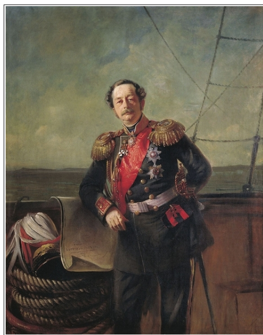
Рис. 3. К.Е. Маковский. Портрет Н.Н. Муравьева-Амурского, 1863 г.