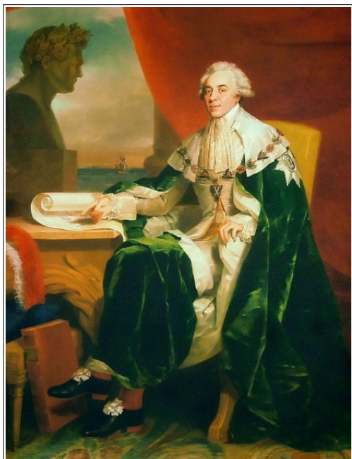
Рис. 7. Дж. Доу. Граф Николай Петрович Румянцев, 1828 г.