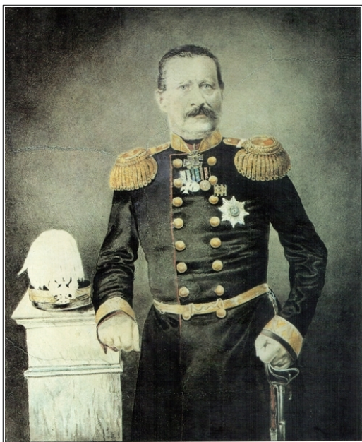
Рис. 2. В.И. Суриков. Портрет губернатора П.Н. Замятнина, 1860-е гг.