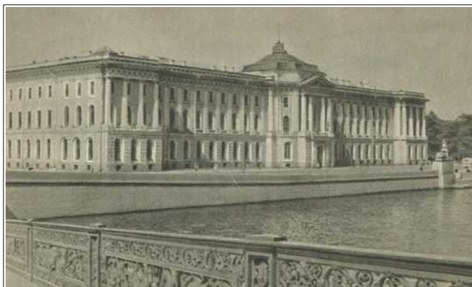
Рис. 9. Здание Академии художеств в Ленинграде на Университетской набережной, 17