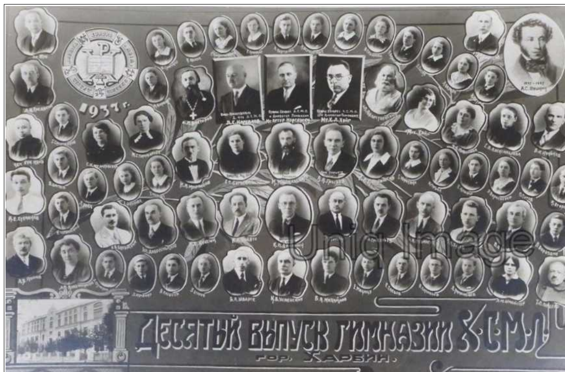
Рис. 5. Десятый выпуск гимназии ХСМЛ. Харбин, 1937 г.