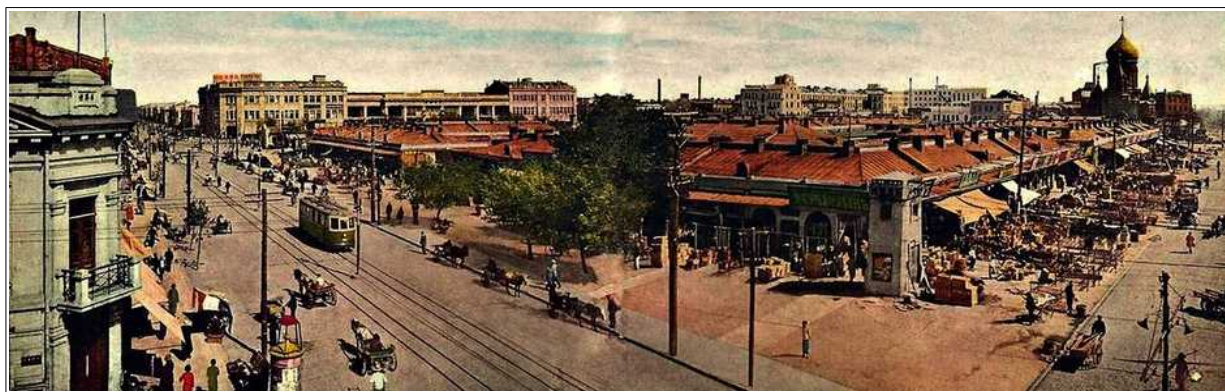
Рис. 2. Вид Харбина. 1930-е гг.

Часть русскоязычных поселенцев, связанных со строительством Транссибирской магистрали, после поражения России в войне покинула Маньчжурию; другая часть, напротив, сосредоточилась в Харбине, где начиналась апробация новых форм «экономической деятельности, общественной жизни, межнационального общения» 2 , открывались консульства Российской империи, США, европейских стран, а в 1907 г. появилась биржа, активизировавшая международную торговлю и развитие города. К 1908 г. Харбин из железнодорожного поселения превратился в полиэтнический город с собственным самоуправлением, в котором жили не только китайцы и русские, но и другие народы – выходцы из Российской империи, создававшие свои землячества, строившие свои церкви, кирхи, костелы, мечети, синагоги и пр. В городе работали русскоязычные учебные заведения: начальные, средние, профессиональные, а потом и высшие. В значительно меньшей степени обучение проходило на китайском и английском языках, а со временем преподавание в частных школах проводилось и на других языках – польском, латышском, татарском. На русском языке издавались газеты и журналы, работали театры, различные общества. В период «русского управления КВЖД», т.е. до 1923 г., Харбин, имевший внешнее сходство с другими российскими городами и даже называвшийся «русским городом на китайской территории», формально «частью Российской империи» 3 не являлся; он становился все более привлекательным для российских и иностранных граждан (рис. 2).