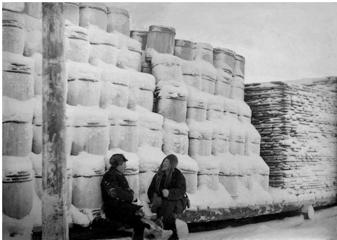
Рис. 3. Штабеля бочек на Обдорском лесопильном заводе

Завод находился на берегу реки Полуй, причальных устройств не имел. Для загона плотов была устроена плавучая гавань длиной 50 м. Основное используемое сырье – круглый лес, поступавший сплавом с лесозаготовок по реке Оби 10 .