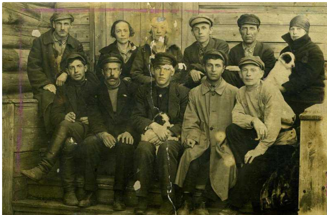
Рис. 6. Работники Обдорского лесотарного завода 1935–1940 гг.

Салехардский лесотарный завод производил важную для рыбного хозяйства региона продукцию, при этом на предприятии имелся дефицит рабочей силы, особенно остро ощущалось отсутствие квалифицированных слесарей и токарей для производства и ухода за оборудованием 27 . В 1943 г. завод не был обеспечен кадрами на 39 %, что также влияло на выполнение показателей плана 28 . В течение 1944 г. на предприятии из 175 работников 131 работал по сдельной форме оплаты 29 . Восполнение дефицита рабочих на предприятиях Ямало-Ненецкого национального округа в годы войны производилось в том числе за счет репрессированных немцев и калмыков, не был исключением и Салехардский лесотарный завод, в частности в 1944 г. на предприятии работали 34 спецпереселенца из Калмыцкой АССР 30 .