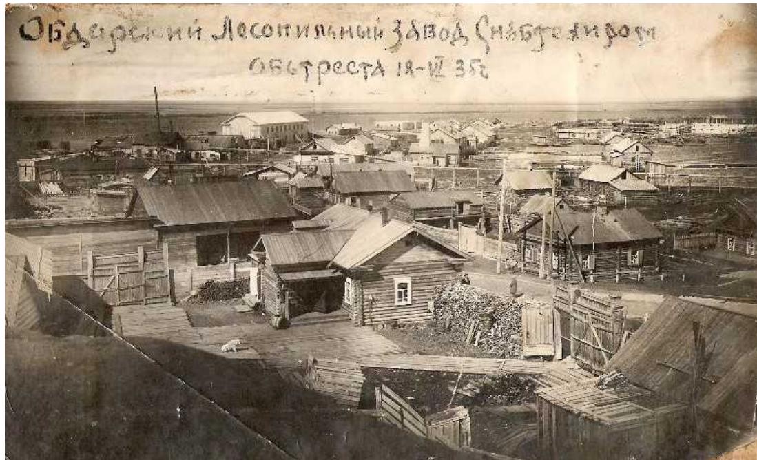
Рис. 1. Обдорский лесопильный завод