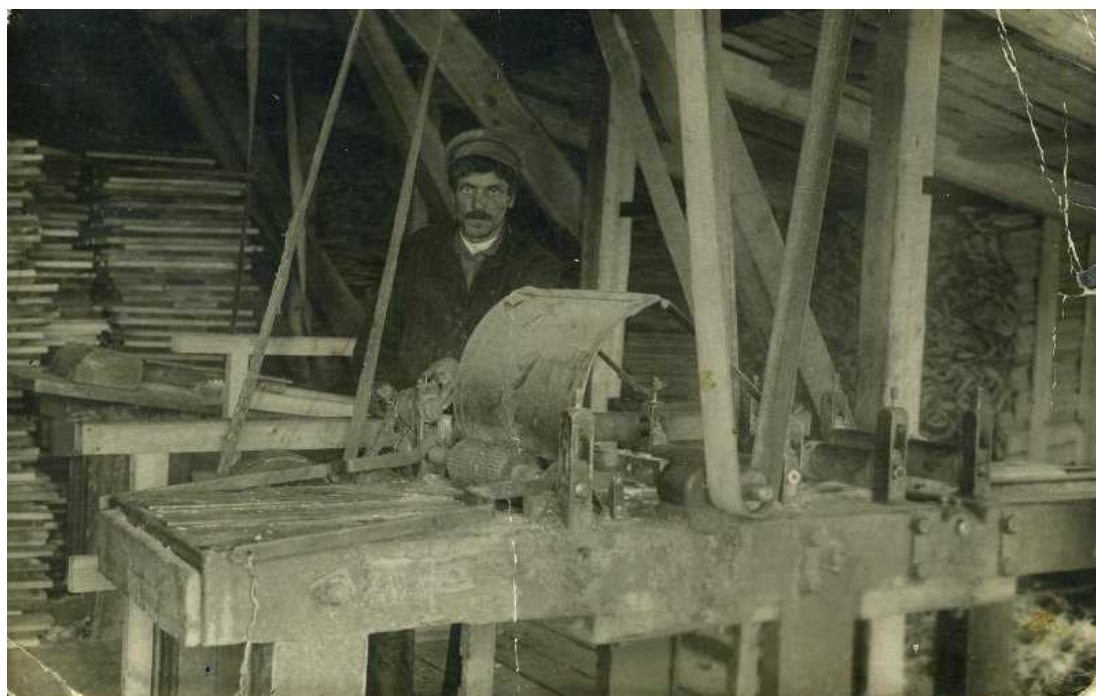
Рис. 5. Работник лесопильного цеха Салехардского лесотарного завода