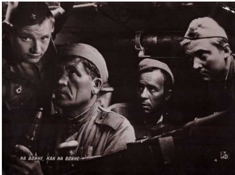
Рис. 4. Кадр из кинофильма «На войне как на войне»