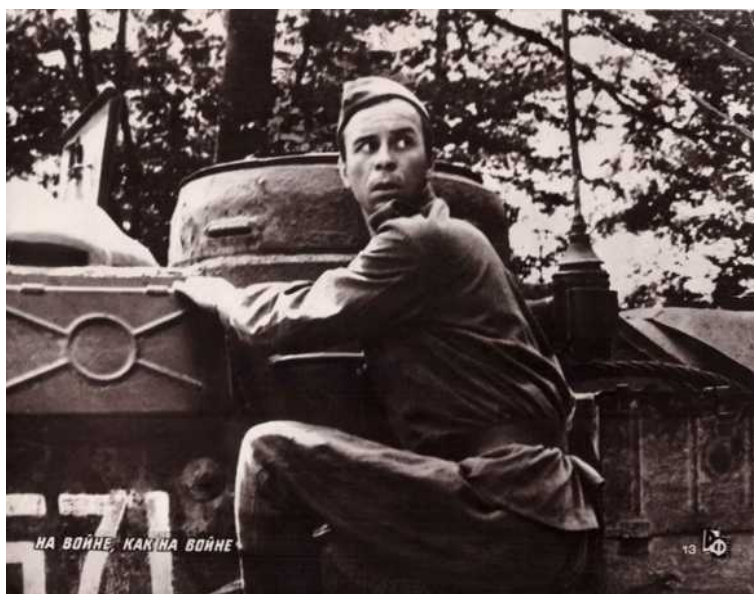
Рис. 5. Кадр из кинофильма «На войне как на войне»