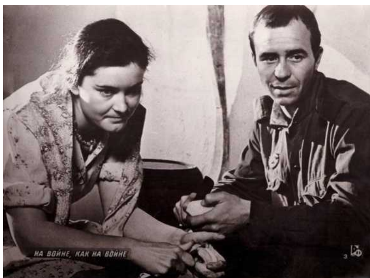
Рис. 7. Кадр из кинофильма «На войне как на войне»