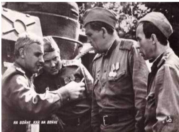
Рис. 6. Кадр из кинофильма «На войне как на войне»