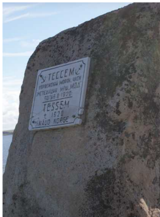
Рис. 4. Диксон. Памятная стела П. Тессему, 2013 г.

Красноярцы сберегли все документы и предметы, так или иначе связанные с визитом Ф. Нансена. Особенное умиление генконсула Норвегии вызвало сохранившееся меню ужина норвежского путешественника, включавшее несколько пунктов сибирских деликатесов и «разные водки». Точность реконструкции была доведена до максимума памятной фотографией возле дома, где останавливался Ф. Нансен, сделанной с разницей в 100 лет (рис. 5).