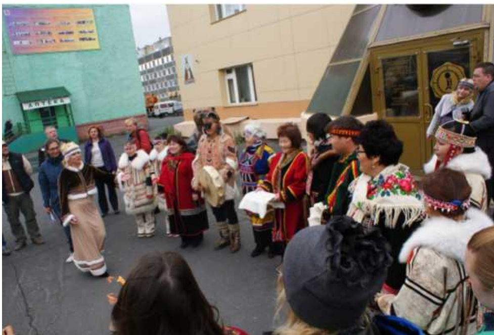
Рис 3. Дудинка. Посвящение в таймырцы, 2013 г.

Местные жители сделали все возможное, чтобы реконструкция событий столетней давности была полной. В 2013 г. участники экспедиции буквально за один день побывали на устроенной в их честь конференции, в музее, Доме народного творчества, Таймырском лицее и даже прошли символическое посвящение в таймырцы (рис. 3). Участники экспедиции отметили богатую экспозицию Таймырского краеведческого музея, аутентичность экспонатов и компоновку коллекций.