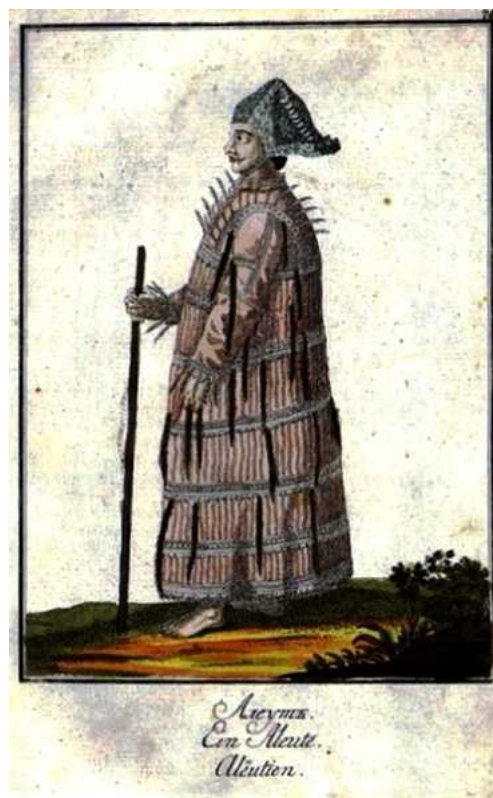
Рис. 5. Изображение алеута из книги И.Г. Георги «Описание всех обитающих в Российском государстве народов», 1799 г.

В трудах и материалах участников экспедиций показано, что вследствие христианизации и вместе с ней шел системный процесс просвещения и аккультурации индигенного населения Сибири по образцу русских. Путешественники отмечали, что «образцы» далеко не всегда были достойны подражания, но и реципиенты часто не являлись послушными учениками. Однако общая тенденция, по данным исследователей, состояла в том, что принявшие православие аборигены стали стремиться получить образование и отдать детей в школу,