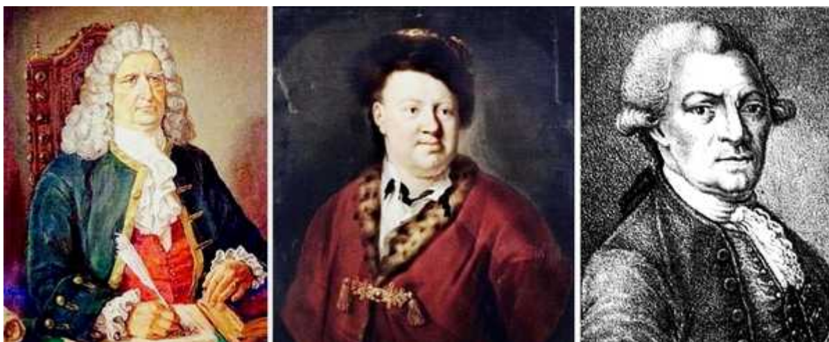
Рис. 1. Слева направо: Портрет Г.Ф. Миллера работы художника Э.В. Козлова, конец XX в.; Портрет И.Г. Гмелина работы художник В.Д. Майера, 1744 г.; С.П. Крашенинников, гравюра А.А. Осипова, начало XIX в.

В своих трудах и материалах участники академических и правительственных экспедиций приводили сведения об изменениях в этническом составе православного населения Сибири и географии распространения данного направления христианства в регионе. В ходе путешествия по Западной и Центральной Сибири в 1721–1723 гг. Д.Г. Мессершмидт посетил территориальные группы крещеных тюркских этносов (сибирских татар, чулымцев, хакасов), проживавших по соседству или в одних поселениях с русскими, а также встречал новокрещеных калмыков и енисейцев 16 . В дневнике путешествия Д.Г. Мессершмидт отметил, что в населенные пункты названных областей направлялись священники для христианизации индигенного населения. К примеру, по его сведениям, в Ачинском остроге «жил священник (поп)», который «должен был живущих вокруг чулымских татар обратить в христианскую веру» 17 . Г.Ф. Миллер, И.Г. Гмелин и С.П. Крашенинников (рис. 1), посетившие в составе АО ВКЭ чулымцев в 1734 г., зафиксировали количественный рост православных аборигенов по сравнению с данными Мессершмидта 18 . И.Э. Фишер в своей работе 1740 г. сообщил, что крещено большинство чулымских тюрков, проживавших на территории от Ачинска до низовий Чулыма 19 .