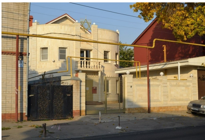
Рис. 3. Современная синагога, открыта в 2013 г.

Вопрос синагоги в конечном итоге был решен другим способом – благодаря спонсорской помощи религиозной общине удалось выкупить земельный участок с недостроенным строением в центре города, расположенный на улице Кузнечная, 27. Затем община на протяжении нескольких лет постепенно достраивала здание, и в 2013 г. состоялось торжественное открытие новой синагоги (рис. 3). Так на карте города появился новый еврейский культовый объект.