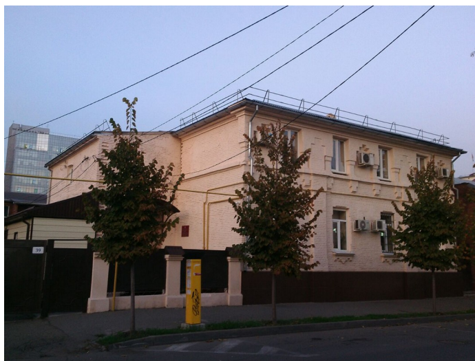
Рис. 1. Здание синагоги, 1881 г.