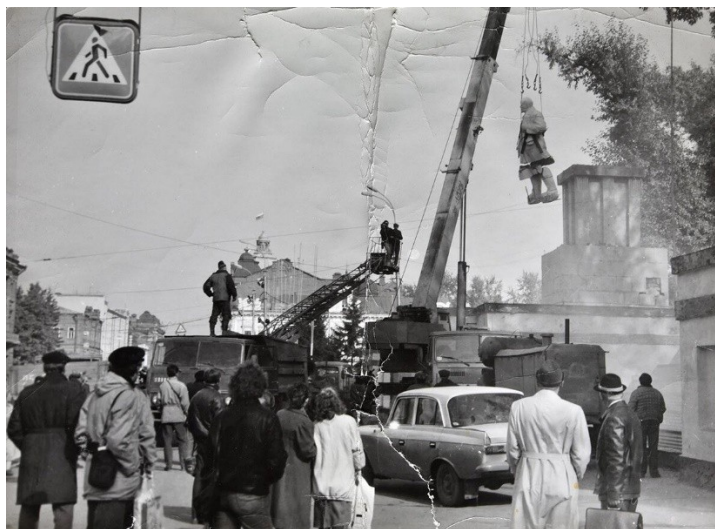
Рис. 2. Демонтаж памятника В.И. Ленину на пл. Революции. 23 сентября 1992 г.

При политических манипуляциях объектами городской площади при создании демократического пространства власти не учитывали реакции городских жителей – читателей нового идеологического текста, в сознании которых репрезентация последователей советской власти продолжала ассоциироваться с памятником В.И. Ленину на площади Революции. К примеру, 7 ноября 1992 г. очередная годовщина Октябрьской революции