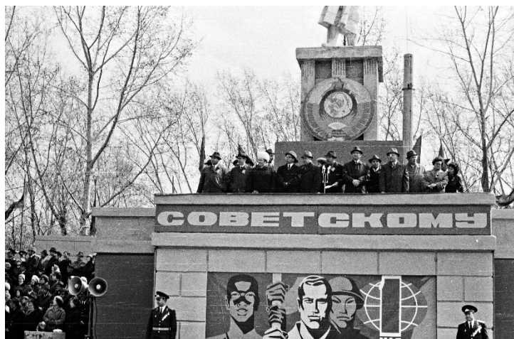
Рис. 1. Первомайская демонстрация в Томске, трибуна на площади Революции, начало 1970-х гг.

Вполне логично, что в контексте делегитимации коммунистического режима в начале 1990-х гг. наличие объектов советской властной топографии в новой политической реальности создавало смысловой диссонанс и символические противоречия для новой власти. Противоборствующие силы в лице сторонников Б.Н. Ельцина и последователей коммунистического режима в первые месяцы после провала путча ГКЧП определили места городского пространства для артикуляции своих высказываний. Так, 21 августа 1991 г. возле здания областного совета («Белого дома») был проведен масштабный антикоммунистический митинг, организованный членами томского отделения партии «Демократическая Россия». «Вообще-то этот угол “Белого дома” под окнами КПСС – излюбленное место проведения политических акций демократов» 10 , – писали в местных газетах. В свою очередь, 15 марта 1992 г. при содействии членов Российской коммунистической рабочей партии (далее – РКРП) на площади Революции прошел митинг в поддержку Чрезвычайного съезда народных депутатов СССР. Предварительно маркировав пространство площади красными флагами и исполнением советского гимна, активисты распространяли свои газеты и организовали сбор подписей в поддержку Чрезвычайного съезда и народного вече, а затем высказывали свою оценку окружающей