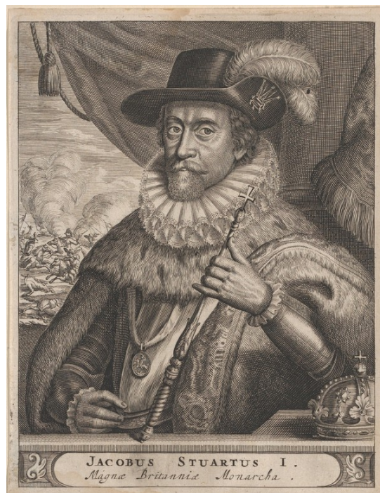
Рис. 3. Портрет Якова I Стюарта. Неизвестный художник, XVII в. ( https://www.metmuseum.org/art/collection/search/750951 )

Таким образом, памфлет Джона Свона следует той самой традиции описаний пуританских экзорцизмов и использует случай Мэри Гловер как еще одну возможность демонстрации чуда избавления при помощи метода молитвы и поста. Однако на страницах своего произведения «скромный верноподданный» Джон Свон раскрывает истинные намерения и причины, побудившие его описать историю Мэри Гловер и привлечь внимание к делу широкой общественности, обратиться к «милостивому Государю, высочайшему величеству Королю»: «...отвергнутый, Я вынужден обратиться к его Высочеству, привлекая