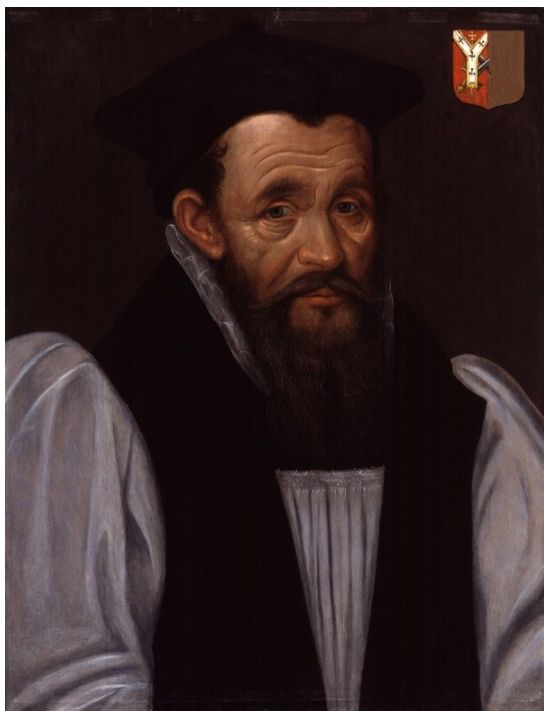
Рис. 2. Портрет Р. Бэнкрофта. Неизвестный художник, Национальная портретная галерея, Лондон.

Суд и дальнейший арест пуританского экзорциста Джона Даррелла и его сторонников стали одной из крупных побед умеренных протестантов в споре об использовании метода молитвы и поста. Инициаторами процесса стали основатели антипуританского движения, начало которому было положено в 1583 г., архиепископ Кентерберийский Джон Уитгифт и его ближайший соратник, впоследствии епископ Лондона Ричард Бэнкрофт (рис. 2). Именно благодаря их усилиям экзорцистская деятельность Даррелла была признана вредной и попала под запрет. По мнению представителей этого крыла протестантской мысли, «своей