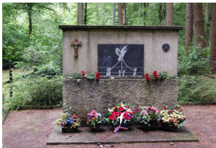
Рис. 6. Памятник погибшим заключенным в Эррувиле.

Еще в 1944 г. Шарль де Голль в Кремле во время диалога с И.В. Сталиным в рамках подготовки к франко-советскому договору, подписанному несколькими днями позже, сказал: «...Французы знают, что сделала для них Советская Россия, и знают, что именно она сыграла главную роль в их освобождении» 31 . В июне 2014 г. Франсуа Олланд в г. Уистреаме на церемонии к 70-летию высадки в Нормандии отмечал «Еще раз, а это никогда не будет слишком много, я хочу подчеркнуть решающий вклад народов того, что называлось Совет-