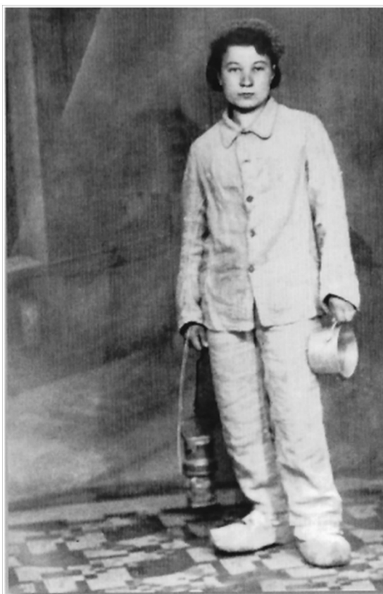
Рис. 1. Заключенная перед спуском в шахту г. Тилия.

работая в глубине шахты вместе с поляками, чей язык со славянскими корнями позволял понимать друг друга, могли общаться между собой. К тому же с помощью подпольщиков удалось организовать материальную и моральную поддержку заключенных лагеря. Они смогли получать новости о ситуации на фронте.