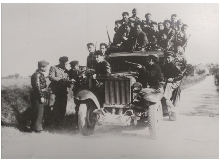
Рис. 2. Члены 1-го Советского партизанского полка во Франции (1944 г.).