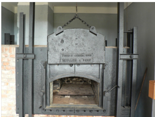
Рис. 2. Крематорий концлагеря в Тиле.