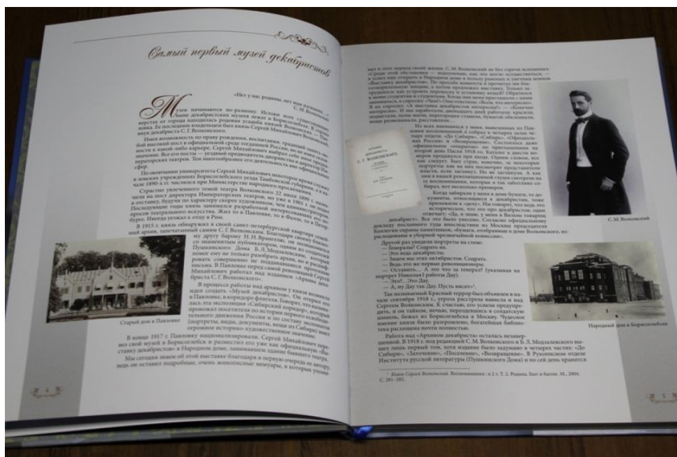
Рис. 1. Разворот иллюстрированного альбома «Иркутский музей декабристов...».