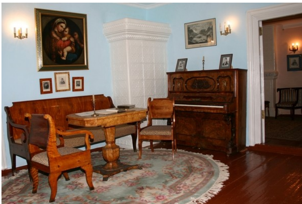
Рис. 1. Гостиная в мемориальном доме декабриста М.И. Муравьева-Апостола.

что немаловажно для развития туристского потенциала малого города России. Его скверы и парки, аллеи и улицы наполнены особым смыслом памяти о декабристах. Это выражено в памятниках, скульптурных композициях, посвященных ссыльным дворянам, из них четыре памятника истории и культуры федерального значения: два дома декабристов М.И. Муравьева-Апостола и И.Д. Якушкина, школа для девочек и могила А.В. Ентальцева. Ялуторовск украшает множество парковых скульптур, большинство из которых – 23 работы – изваял местный скульптор Владимир Николаевич Шарапов, член Союза художников РФ, Почетный гражданин Ялуторовска. В его творчестве особое место принадлежит декабристам. Бюст И.Д. Якушкина «встречает» посетителей у здания бывшей всесословной школы для девочек (ныне – информационно-методический центр при Комитете образования администрации г. Ялуторовска), композиция «Скорбящий ангел» установлена в память об упокоенном в Ялуторовске В.И. Враницком на территории Духовно-мемориального комплекса (рис. 2).