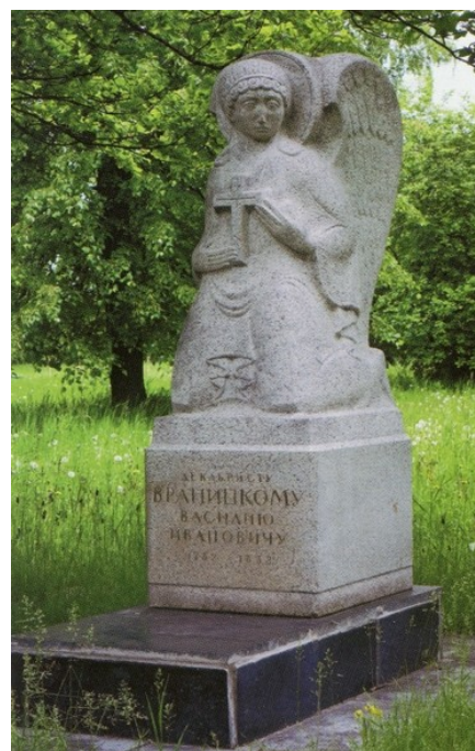
Рис. 2. Композиция «Скорбящий ангел» в память об упокоенном В.И. Враницком на территории Духовно-мемориального комплекса г. Ялуторовска.

Характеризуя лишь часть тех людей, которые вынужденно поселились на Ялуторовской земле, невольно возникает вопрос, что же помогало сблизиться декабристам? Принадлежность «их дум к высокому стремленью»? Да, возможно, их все еще связывало прошлое, но к событиям 14 декабря 1825 г. в беседах друг с другом они почти не обращались. Ответить на этот вопрос помогает эпистолярное наследие, оставленное в виде писем и записок И.Д. Якушкина, а также воспоминания А.П. Созонович. И.Д. Якушкин писал своей невестке, жене сына Евгения: «Все мы здесь почтенного возраста, что не мешает нам, когда собираемся вместе, – а случается это очень часто, спорить, как студентам, и кричать, как носителям реклам, и все это без малейшей ссоры» 9 . А.П. Созонович называла их «единодушной