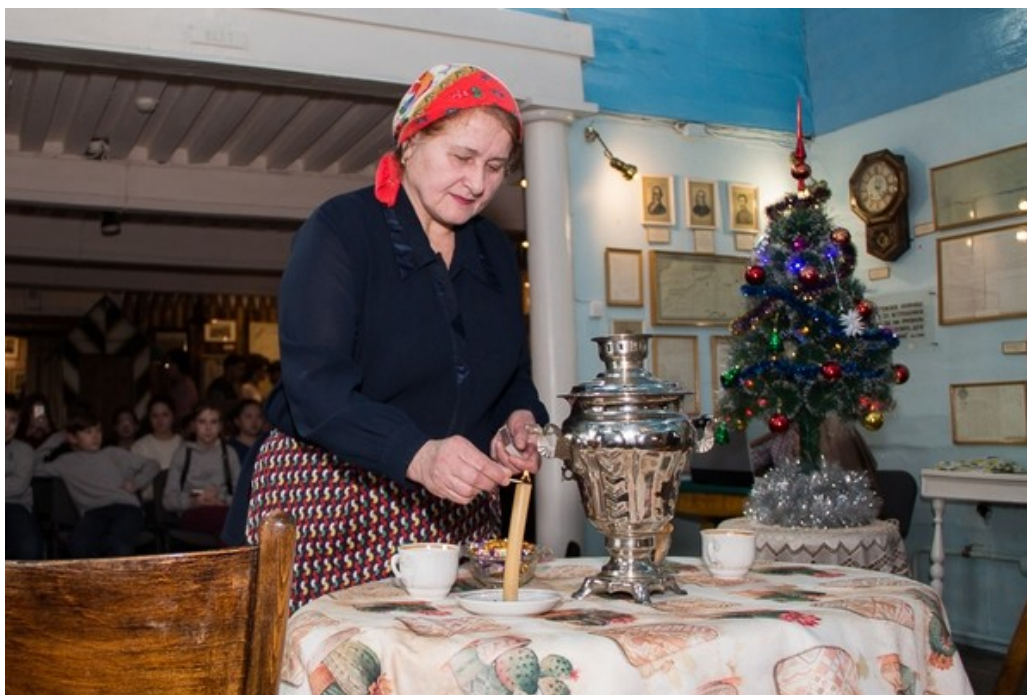
Рис. 4. Рождественские посиделки, 2018 г.

Для детей и подростков разного возраста в музее сформированы образовательные программы. Самые маленькие посетители знакомятся с музейными экспонатами на экскурсии «Здравствуй, Музей!». В игровой форме дошкольники и школьники узнают об истории и культуре XIX в. на интерактивных занятиях и мастер-классах «От гусиного пера и до компьютера», «В старину учились дети», «Родом из детства» и др. Юбилейные даты, знаменательные события освещаются на музейных праздниках, таких как «Страницы жизни декабристов в Чите», «Во глубине сибирских руд...», «Рождественские посиделки», «Масленица к нам пришла!» (рис. 4).