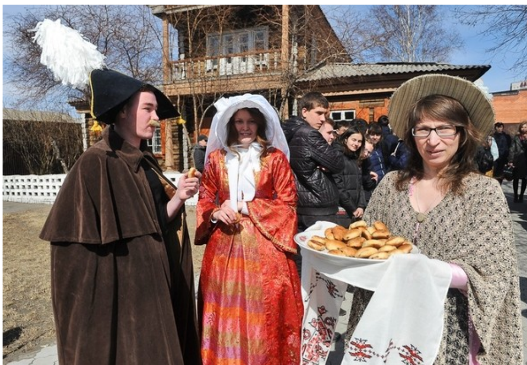
Рис. 6. Участники флешмоба «Ожившая картина».

Совместно с Забайкальским краевым училищем искусств в музее проходят литературно-музыкальные гостиные «Язык цветов», «Стихия музыки – великая стихия», «Шедевры пушкинской лирики» и др. Заслуженные деятели искусств края исполняют музыкальные произведения, в т.ч. на музейных экспонатах – фисгармонии и фортепиано XIX в. На протяжении 15 лет музей совместно с Забайкальским краевым драматическим театром реализует проект «Театр под сводами музея» – театрализованные постановки на декабристскую тема-