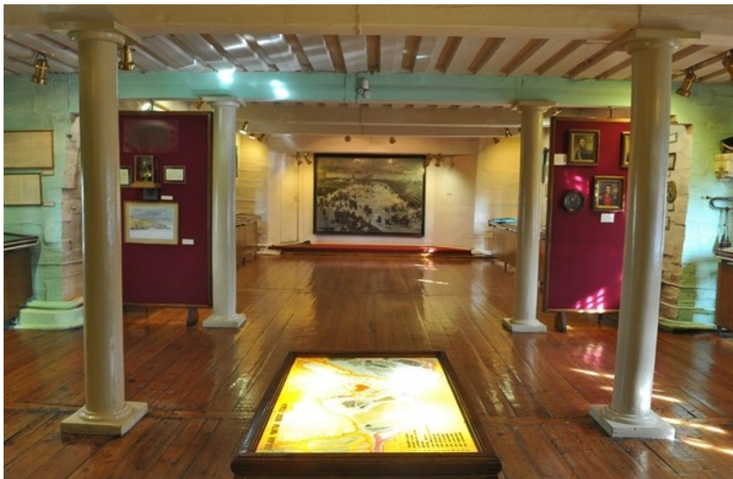
Рис. 2. Общий вид первого этажа.

Была принята идея развернутого показа движения декабристов. На первом этаже были даны материалы о нем, начиная от формирования мировоззрения декабристов и заканчивая отправкой в Сибирь (рис. 2). На втором этаже представлены разделы «Каторга», «Поселение», «Жены декабристов», «Амнистия» (рис. 3). Архитектурно-художественное оформление экспозиции было разработано художником Ленинградского комбината живописно-оформительского искусства Г.Г. Кравцовым 3 .