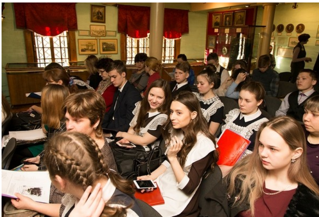
Рис. 5. Декабристские чтения, 2019 г.

порта перевоплотились в героев картины «Венчание Анненковых в Чите» забайкальского художника Н.М. Полянского (рис. 6).