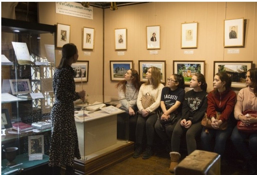
Рис. 8. Презентация выставки «И в Сибири светит солнце...», 2019 г. Фото научного сотрудника М.Ю. Федосеева, Забайкальский краевой краеведческий музей им. А.К. Кузнецова.

острога», «Высок и свят их подвиг незабвенный» и др. Результатом научно-исследовательской работы в Государственном архиве Забайкальского края стали статьи о населении каторжных мест Забайкалья к моменту прибытия декабристов, об окружении декабристов в период пребывания их на каторге в Сибири, издание альбома «Места каторги, поселения, захоронения декабристов в Сибири». Данные материалы использованы в экспозиции. Архивные документы легли в основу книги «Тот храм, построенный из бревен», в которой освещена история Михайло-Архангельской церкви.