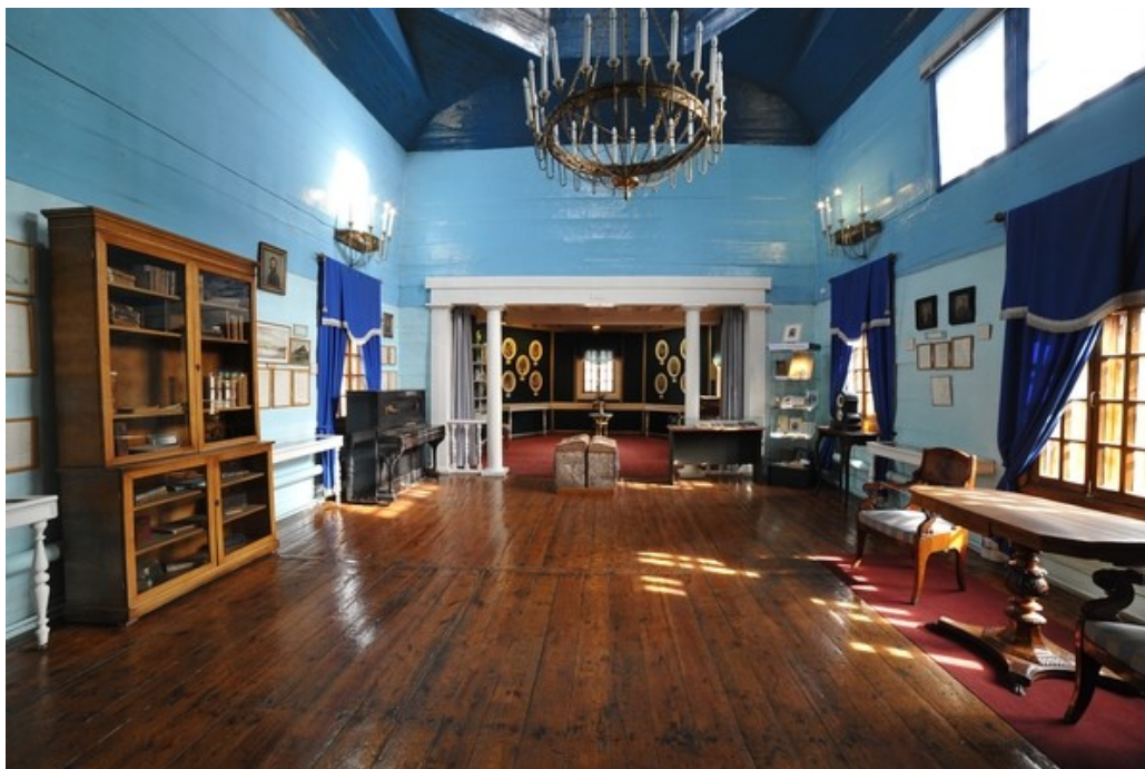
Рис. 3. Зал «Поселение».