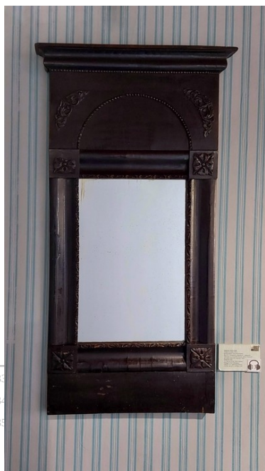
Рис. 5. Зеркало в экспозиции кабинета М.Н. Волконской в Доме-музее Волконских.

После довольно оживленной переписки в августе, особенно со стороны М.П. Волконского, наступает небольшой перерыв,