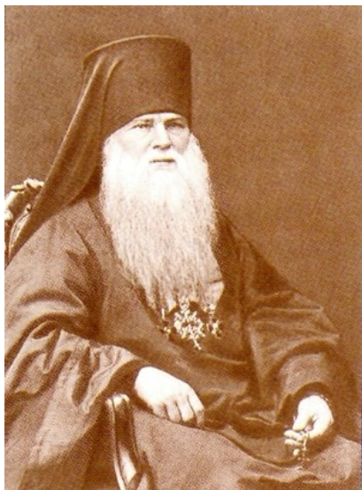
Рис. 2. Амвросий (Ключарёв), архиепископ Харьковский. Фото конца XIX в.

уже с начала XVIII в. Начиная со второй половины XIX столетия на фоне общественного подъема в стране по-своему активизируется жизнь и в белокриницких общинах. Выдвигаются новые лидеры, формируются группировки, нередко выходившие с достаточно смелыми, продуманными инициативами, включая вопросы внутренней организации, образовательных и издательских проектов. В то же время усиливается противодействие со стороны церковных и гражданских властей, официозных и собственных консервативных кругов.