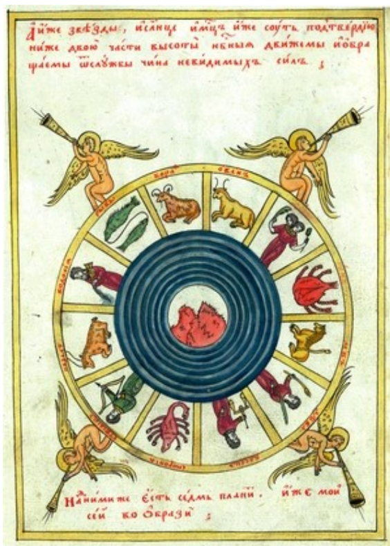
Рис. 3. Миниатюра из «Христианской топографии» Козьмы Индикоплова. Рукопись XIX в. Собрание Института истории СО РАН.