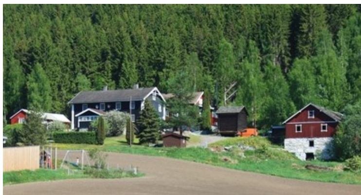
Рис. 6. Ферма Крамперуд.