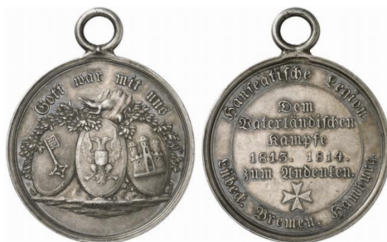
Рис. 11. Медаль Ганзейского легиона «В память патриотической борьбы 1813–1814» (из коллекции автора).