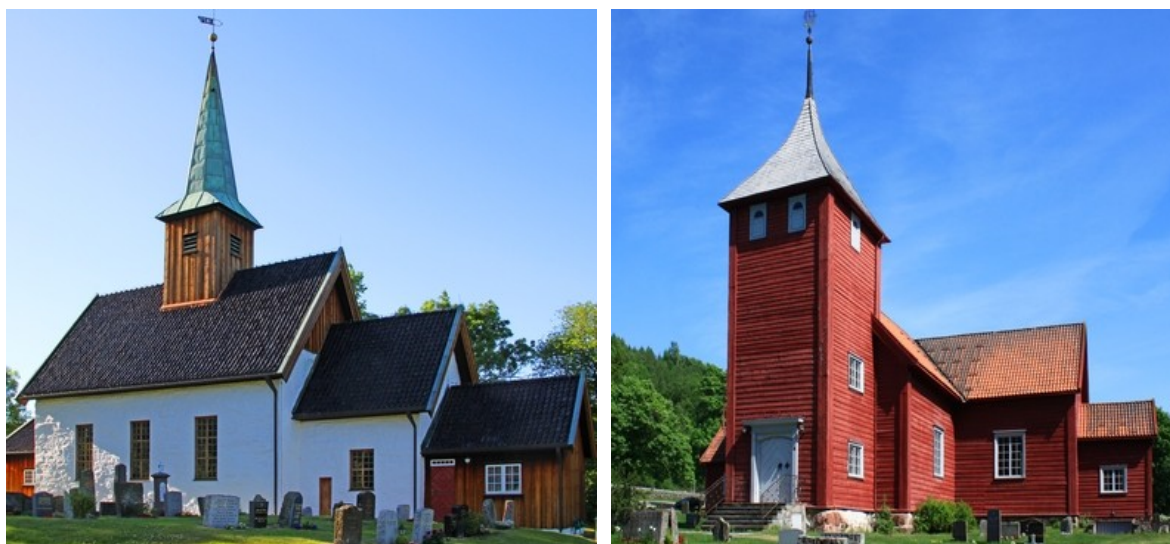
Рис. 2. Кирхи в Несоддене (слева) и Фоберге (справа).

В Фоберге сохранилась деревянная кирха (1727; рис. 2). Этот храм известен тем, что в нем хранится купель, вырезанная из мыльного камня и датируемая 1100 г., а рядом с церковью стоит монолитный рунический Фоберг-камень эпохи викингов.