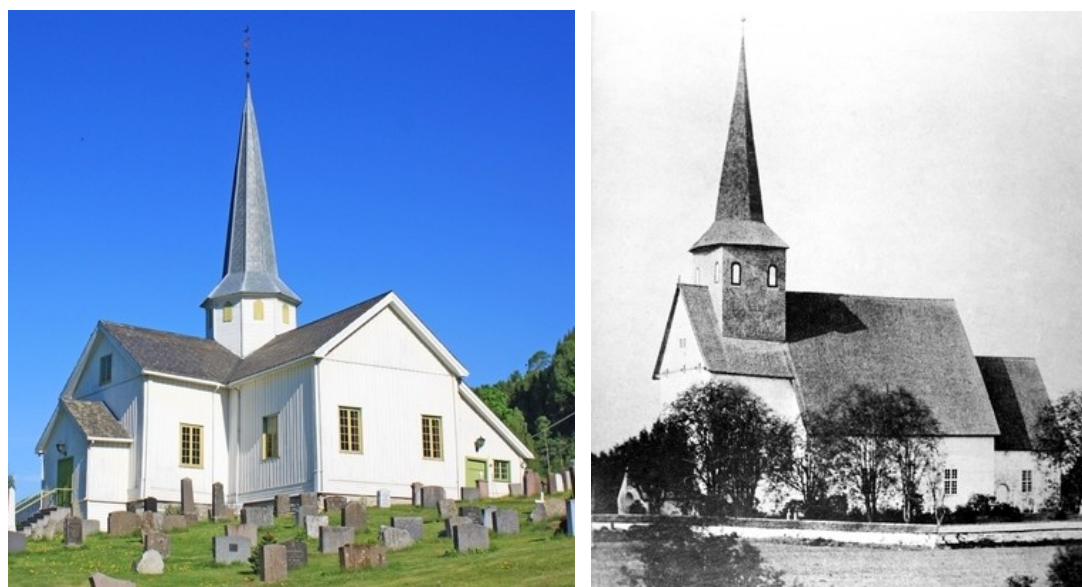
Рис. 3. Кирхи в Эйере (слева) и Ромедале (справа; фото начала 1880-х гг.).