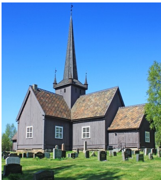
Рис. 5. Кирха в Леше.