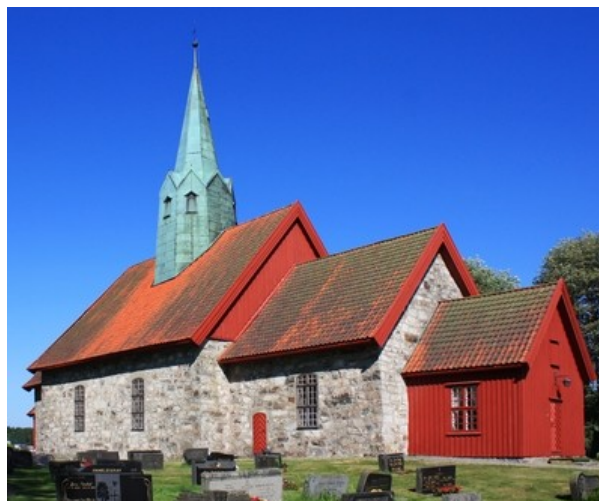
Рис. 7. Кирха в Шиптвете.

В Шиптвете сохранилась кирха (1200; перестроена после пожара в 1762; реставрирована 1937) и вокруг нее старое кладбище (рис. 7). Могилы представителей семьи Руге не сохранились.