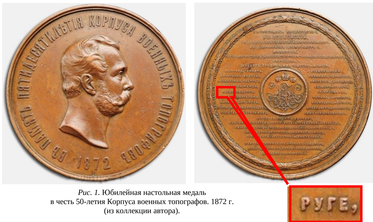
Рис. 1. Юбилейная настольная медаль в честь 50-летия Корпуса военных топографов. 1872 г. (из коллекции автора).