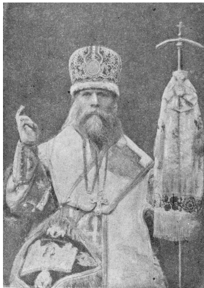
Савватий (Левшин), архиепископ Московский.

Публ. по: Старообрядческий церковный календарь на 1956 г.